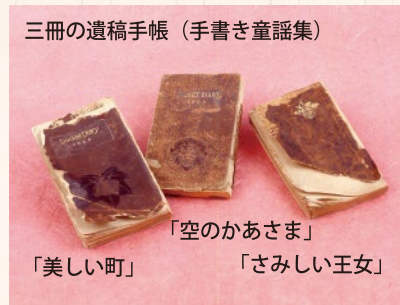
三冊の遺稿手帳(手書き童謡集)